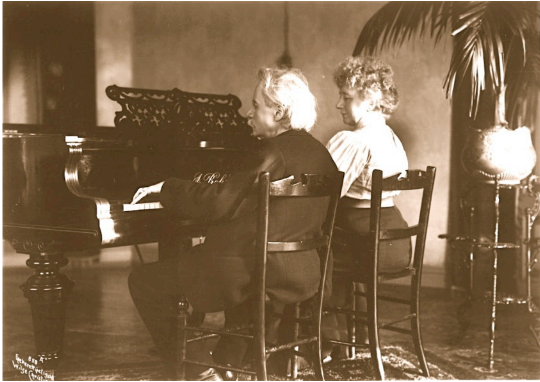
Edward Grieg amb la seva esposa Nina Hagerup tocant el piano a quatre mans

Les dues melodies elegíiques op. 34 daten del 1881 i són transcripcions de les cançons op. 33 números 3 i 2 amb textos d'A. O. Vinje, la primera titulada Hjertesår (El cor ferit) i la segona Våren (Primavera). D'arravatades podem qualificar aquestes melodies, com a música descriptiva que són, els seus títols evocuen les atmosferes per les quals transcorrerà el discurs sonor.