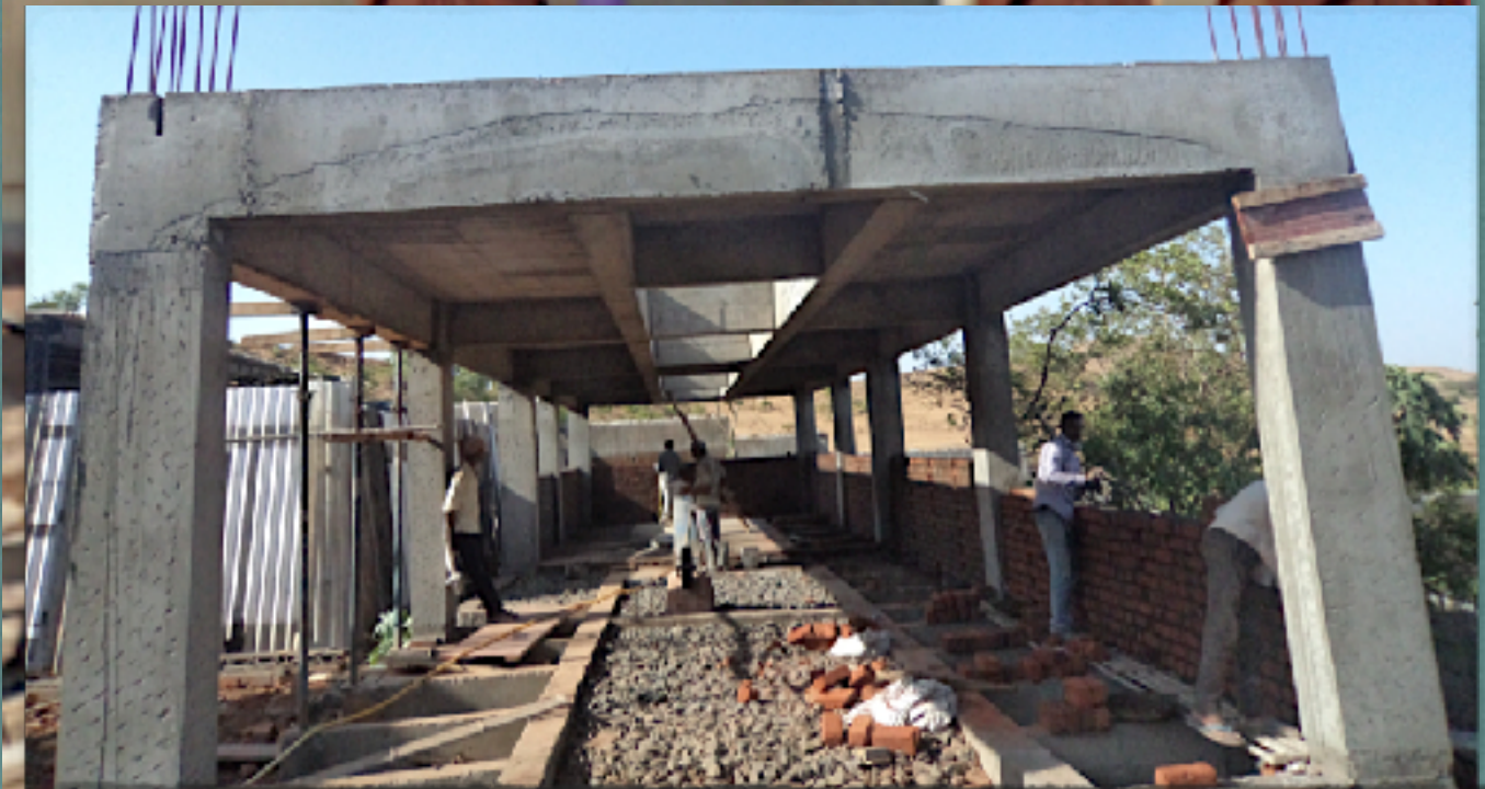
Fotografies de les noves aules en construcció.