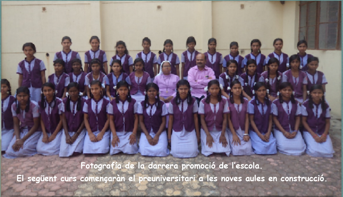
Fotografia de la darrera promoció de l'escola. El següent curs començaràn el preuniversitari a les noves aules en construcció.