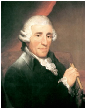
Franz Joseph Haydn

Franz Joseph Haydn va treballar la major part de la seva vida per a la família Esterházy. Era el 1761 quan el poderós i ric príncep Paul Anton Esterházy va demanar un lloc d'ajudant de director musical. Haydn amb 29 anys va acceptar i va firmar un contracte del qual tenim còpia. Les condicions són les mateixes que en Rosseau va denunciar com a estafes. En realitat era un vincle pel qual tota la seva persona, les seves accions i obres passaven a ser propietat del príncep. A més les seves obligacions no eren estrictament musicals sinó que comprenien la supervisió, normes i obligacions d'altres subordinats, com ara, vetllar per la correcta vestimenta, empolvorat i col·locació de les perruques. Com a cap de la música, a part d'assajar, dirigir i tenir cura del manteniment dels instruments de palau, Haydn renunciava a tota propietat intel·lectual de les seves composicions, aquestes passaven a ser propietat del príncep i no es podien utilitzar sense la seva aprovació. Així Haydn esperava cada dia les ordres del príncep i aquest li comanava la música que volia (una òpera, un quartet, una simfonia...). Per fer-nos una idea del treball direm que en la dècada de 1770 a 1780 s'hi registraren 800 actuacions al palau, això és aproximadament un event cada quatre o cinc dies.