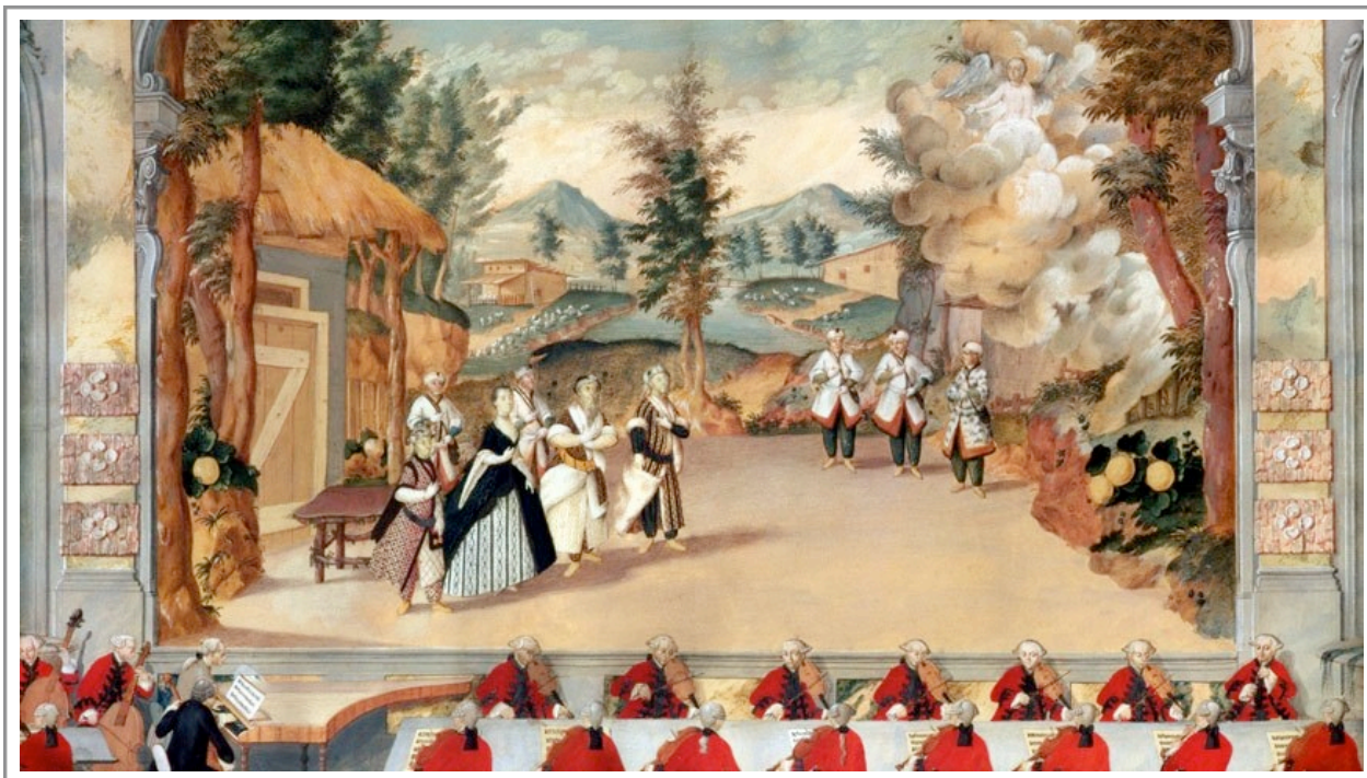
Haydn dirigint al clavecí una òpera al Palau dels Esterházy,

Com totes les misses del compositor trobem una perfecta adaptació dels texts amb el discurs musical, tant en la forma com en el contingut i podríem dir que cap altre compositor de música sacra ha transmès la devoció, la felicitat pietosa i la celebració litúrgica amb tanta empatia com ell. L'obra concedeix al quartet vocal solista un protagonisme en el "Et incarnatus" i el "Benedictus", ambdós tenen una frescor melòdica i una harmonia dramàtica que desprenen una forta expressió i contrast. El cor té un gran protagonisme amb intervencions de molta força i explosives asseveracions basades als texts. Destaquen i es contraposen el "Gloria", el "Sanctus" i "Agnus Dei", la inventiva de Haydn queda palesa en tota l'obra. Per al "Dona nobis pacem", Haydn pareix que no va tenir temps d'escriure'l i va optar per seguir el costum molt arrelat a Viena a l'època d'utilitzar la mateixa música del "Kyrie", segons sembla, ho va fer al darrer moment i els coristes varen haver d'improvisar l'aplicació de la lletra a la partitura.