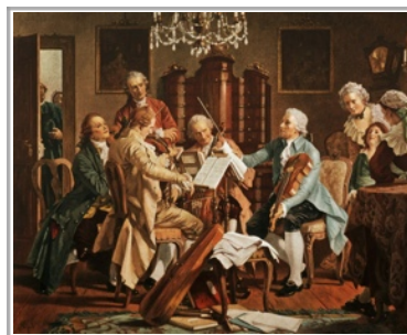
Haydn al primer violí

Tras el regreso a Eisenstadt, Haydn (no sabemos si como encargo del príncipe o tal vez como agradecimiento) compuso para la onomástica del príncipe una misa que se estrenó el día 6 de diciembre, día de San Nicolás. Haydn la compuso sin demasiado tiempo, ya que eran muchas sus obligaciones y encargos para el príncipe. La misa obedece al modelo vienés basado en la encíclica papal de 1749, en ésta se exigía el texto completo y comprensible musicalmente hablando. Haydn comenzó el Kyrie con un poco habitual compás de 6/4 que le da un marcado carácter pastoral.