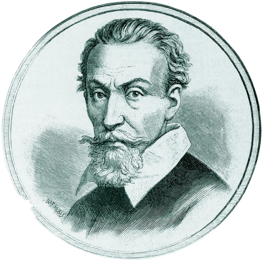
Claudio Monteverdi (1567-1643)